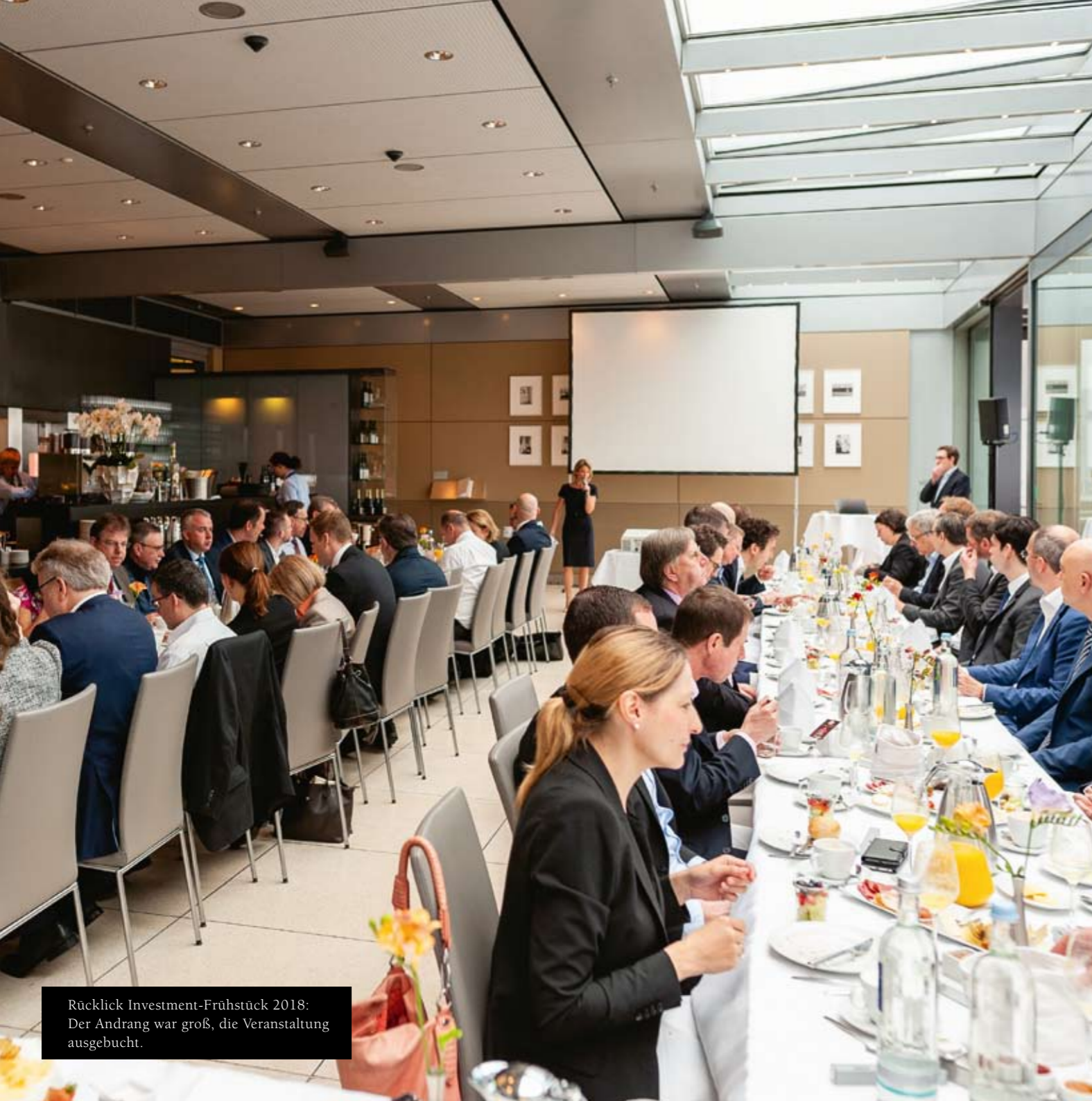
Rückblick Investment-Frühstück 2018: Der Andrang war groß, die Veranstaltung ausgebucht.