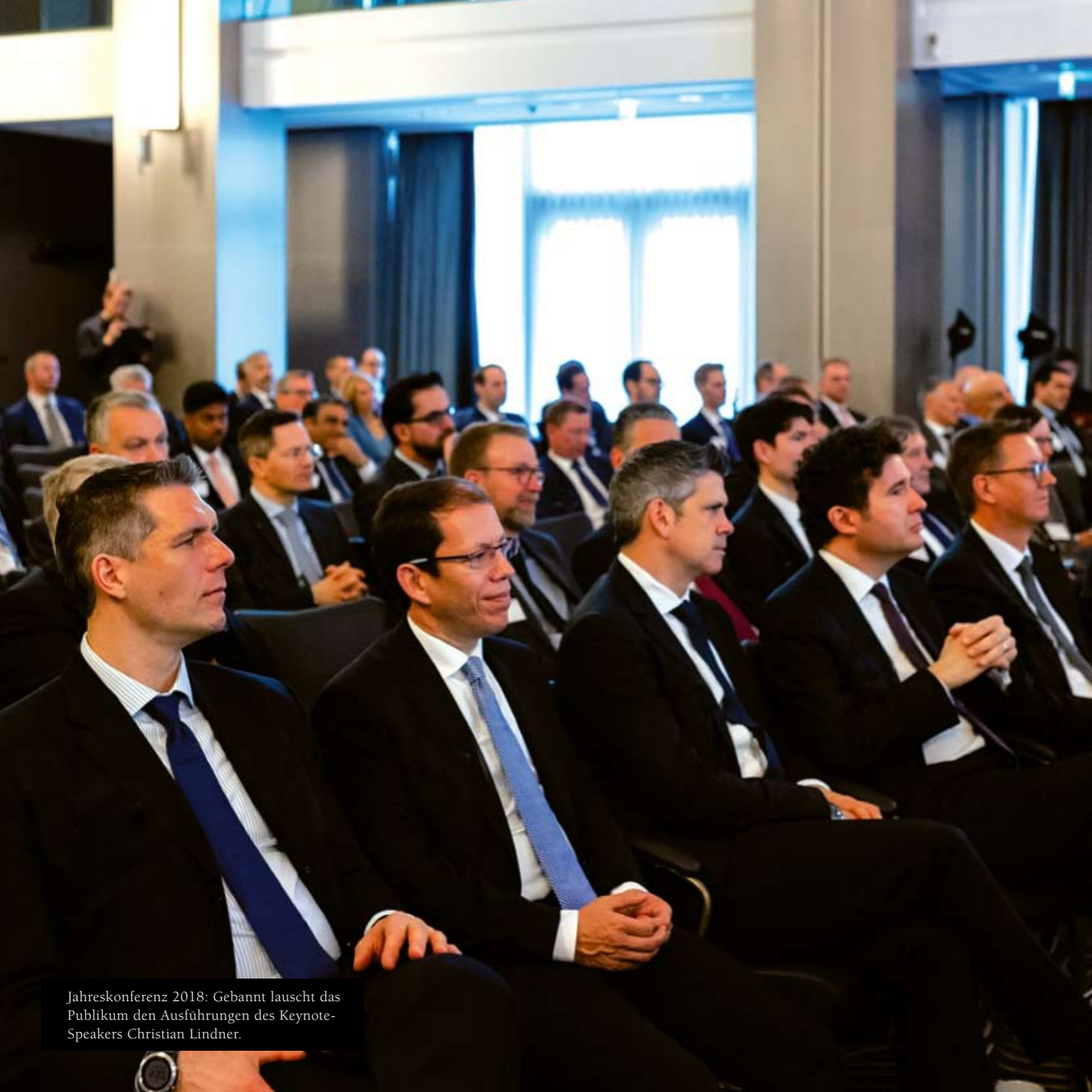
Jahreskonferenz 2018: Gebannt lauscht das Publikum den Ausführungen des Keynote-Speakers Christian Lindner.